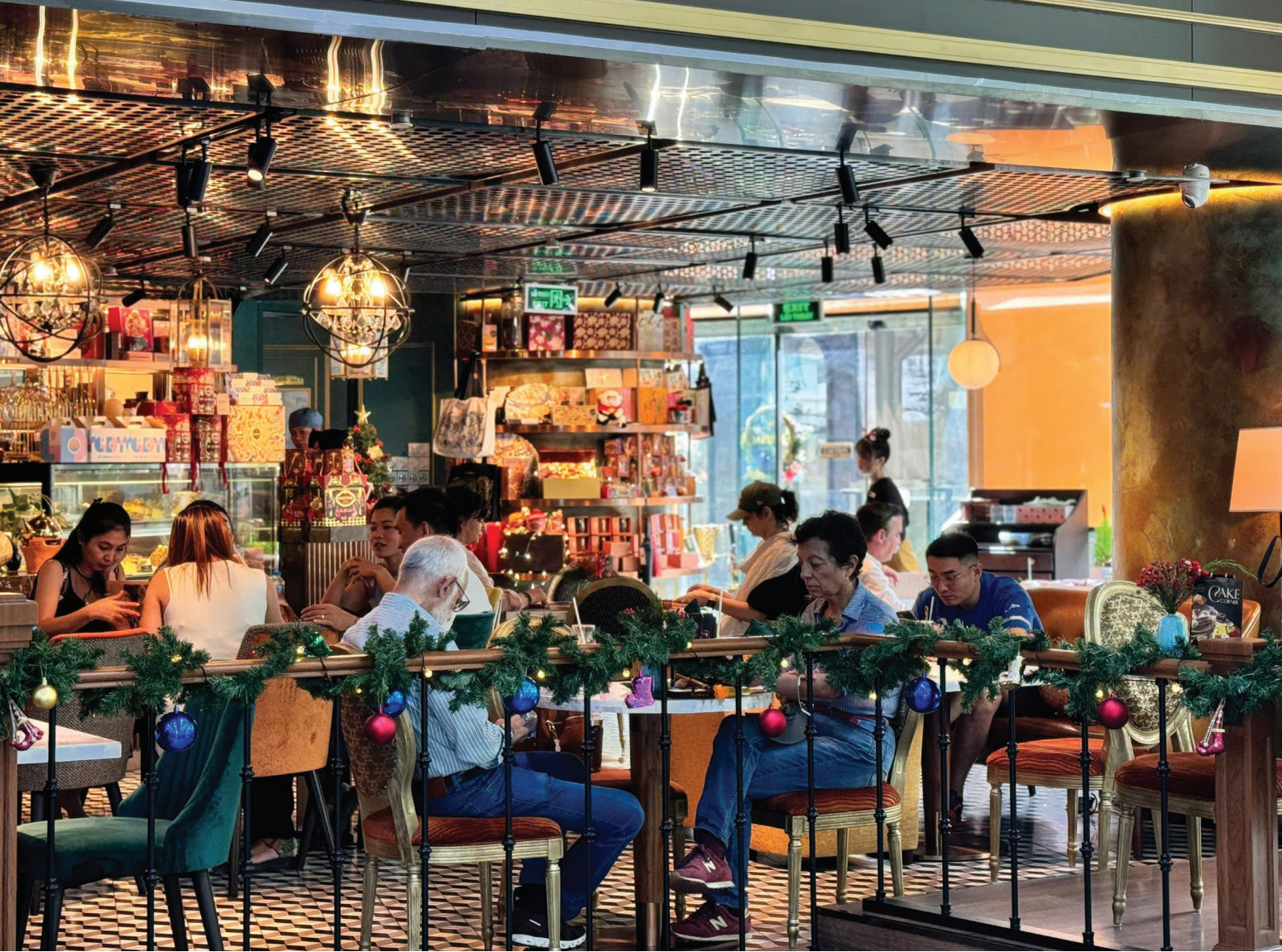
Năm nay, ngành F&B của Việt Nam chứng kiến nhiều thương vụ M&A quan trọng, cho thấy sự năng động và tiềm năng phát triển của thị trường

trong ngành F&B, nhờ vào nguồn tài nguyên và chi phí lao động cạnh tranh. Tuy nhiên, vẫn còn nhiều rào cản đáng kể đang kìm hãm tiềm năng của ngành.